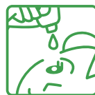
容器の先と目やまつ毛がふれることのないように