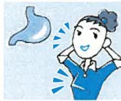
3 直接・効果的に作用します