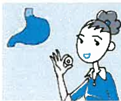
1 かみくだと有効成分が じわじわと食道を通過